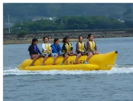
(バナナボート：6人乗り)