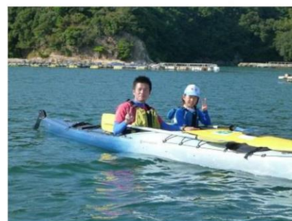
(カヌー：1人乗りと2人乗り有)