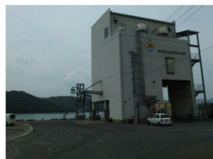
(受付目印：愛南漁協御荘製氷施設)